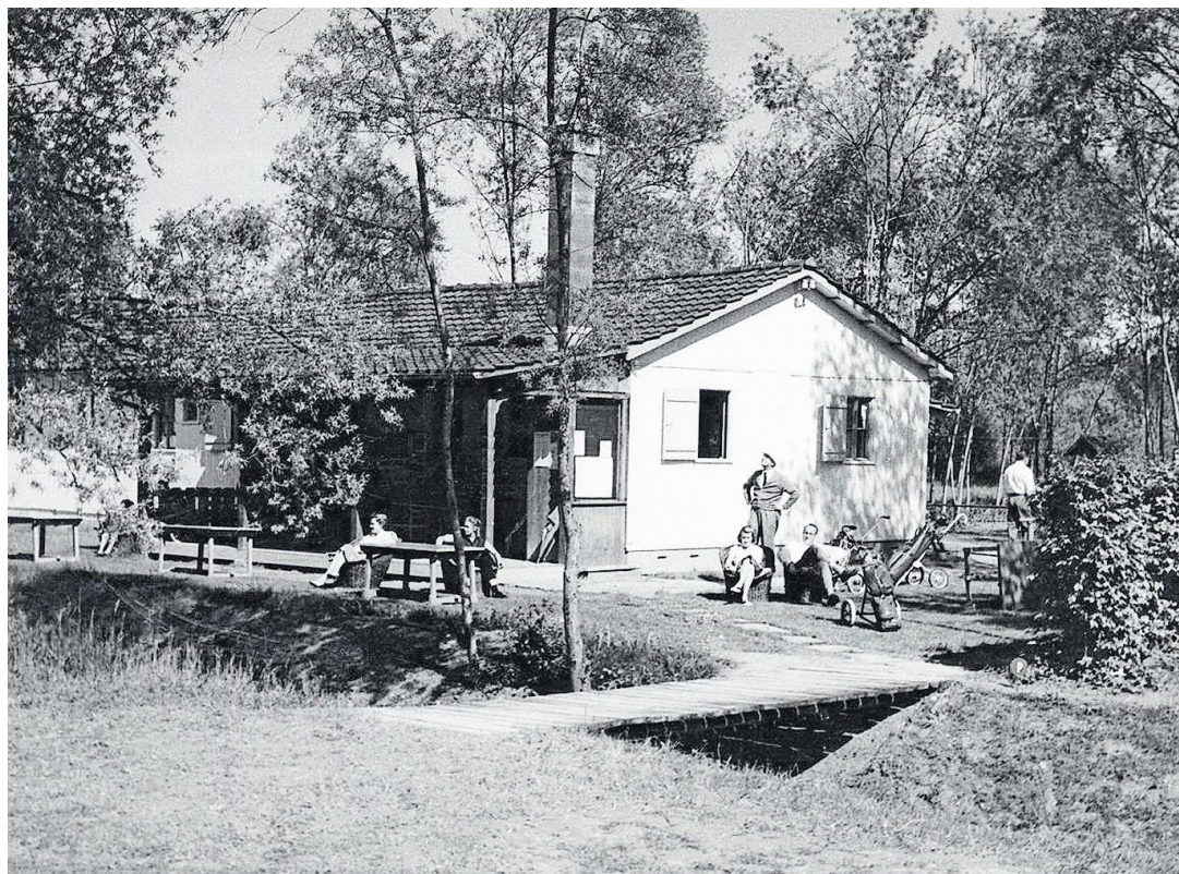
Das ehemalige Clubhaus, eine alte Militärbaracke, von 1948.

Ein weiterer Unterschied wird betont: «Spieler, die zu uns kommen, nehmen sich Zeit. Dies ist im heutigen Alltagsstress oft sehr schwierig und ist deshalb