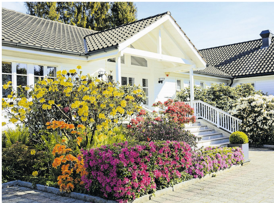
Das alte Clubhaus wurde 1993 durch einen Neubau ersetzt.

«Der OSGC legt viel Wert auf den gesellschaftlichen Umgang im Club.»